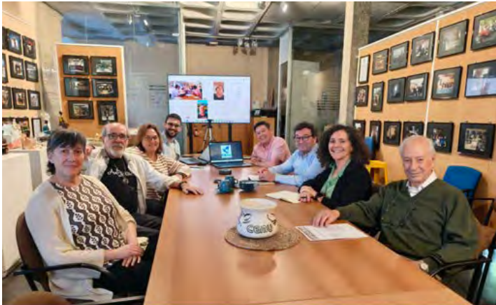
Miembros de la Junta Directiva de la Asociación CiudadEscuela Muchachos

Los socios de la Asociación Muchachos, propietaria de la CEMU y responsable del recurso de hogares residenciales, aprobaron sus cuentas anuales en la Asamblea General. Las cuentas, que han sido auditadas, corresponden al ejercicio de 2025, en el que se ha obtenido un resultado positivo por tercer año consecutivo. El año pasado se alcanzó un superávit de más de 81.000 euros, con unos ingresos estables similares al ejercicio previo. Además, los socios aprobaron una amortización extraordinaria del préstamo hipotecario para reducir la deuda a largo plazo, que supera ligeramente los dos millones de euros.