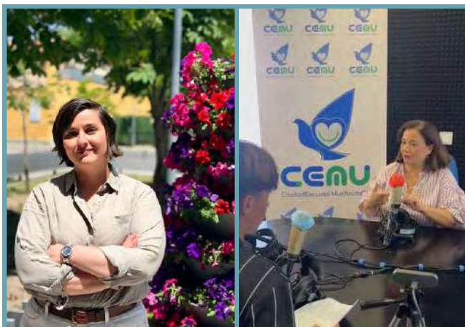
Las concejalas de Medio Ambiente y Juventud del Ayuntamiento de Leganés hacen balance de su gestión