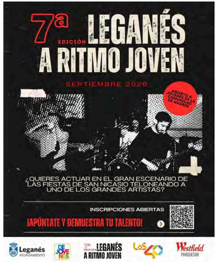
Cartel VII Certamen de Música 'Leganés a Ritmo Joven'

En Igualdad estamos trabajando muchísimo la independencia económica de las mujeres, porque es fundamental para erradicar esta forma de violencia de género, la violencia económica, que es quitarle a una mujer su posibilidad de vivir independientemente. Y, por otro lado, trabajamos mucho con el problema tan grande que existe con la violencia entre adolescentes. Somos muy incisivas en toda esa violencia digital, que se apodera de las chicas jóvenes, permitiendo que se cuelen en su vida o que tengan que acabar haciendo cosas que nunca hubieran pensado que harían, porque al final están siendo absolutamente manipuladas. El año pasado lanzamos una campaña que se llamaba "Que no te enreden", para que las chicas jóvenes que se ven en esas situaciones, en esa espiral de relaciones tóxicas en las que a veces las personas en general entramos, vean que a veces damos por normales comportamientos que no lo son y hay que saber identificarlos, pedir ayuda y salir de ahí lo antes posible.