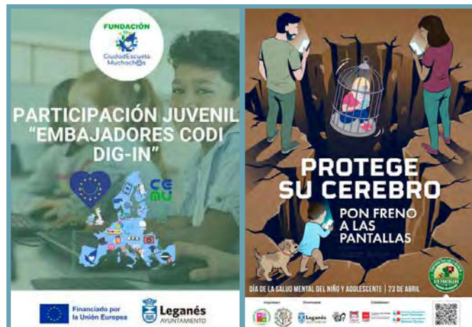
Especial Bienestar Digital