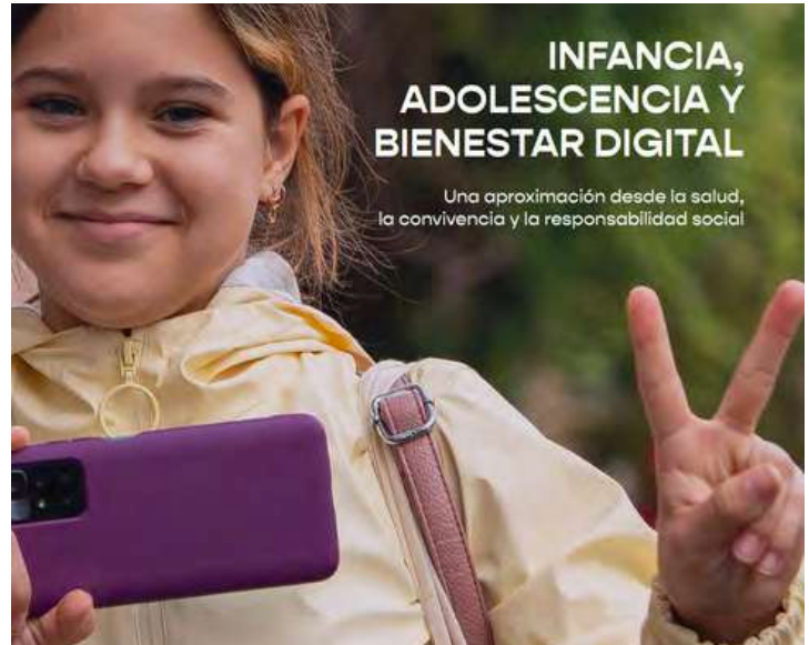
Portada de la publicación de Unicef, "Infancia, adolescencia y bienestar digital"

Pues pueden dar formación y pueden concienciar. Creo que es importante, si chicas y chicos mayores que han pasado por ahí, que se han enganchado mucho o que han tenido ya esa experiencia, si os lo explican y os aclaran las consecuencias y los problemas que tuvieron. Yo creo que a veces es fundamental que os lo puedan contar vuestros iguales y no sólo profesores o padres o expertos. Creo que en los colegios, sobre todo, se puede dar formación y crear espacios de diálogo.