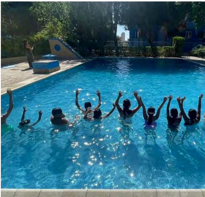
Los niños y niñas se bañan en la piscina comunera

Nuestra propuesta es un viaje en el tiempo. Cada semana vamos a ver diferentes civilizaciones y épocas, por ejemplo la Prehistoria, la Edad Media o los indios.