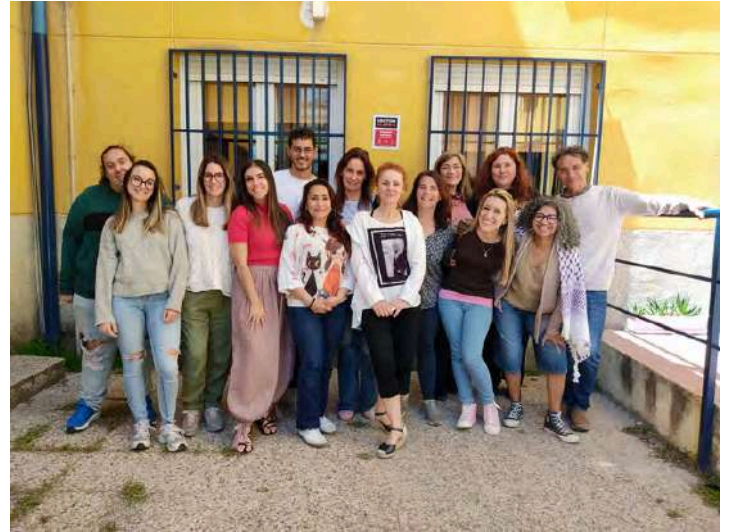
Equipo de Atención Temprana de Leganés

Pues mira, ahí es verdad que no vamos a entrar en marcar una edad. Nosotros creemos en el buen criterio de las familias, porque hay muchas casuísticas y hay familias que por necesidad les tienen que dejar a sus hijos un móvil porque los papás no están en casa y necesitan estar conectados con ellos. Pero siempre recomendamos un control parental que limite el acceso a cualquier tipo de contenido y también el tiempo de uso. Y si eso no sabemos hacerlo o no podemos, siempre pueden contar con nosotros, pero todavía siguen existiendo móviles sin acceso a internet que son solo para llamada. Entonces es verdad que no vamos a buscar enmarcar una edad concreta. Entendemos que cada familia funciona de una manera, pero sí que lo que hacemos es apelar a la responsabilidad de cada adulto, a la supervisión y, sobre todo, al acompañamiento. A veces sale en documentales que los niños confiesan lo que ven y las mamás o los papás los miran alucinados porque no tenían ni idea de que sus hijos estaban viendo eso. Entonces, si has abierto una puerta en la habitación de tus hijos, asegúrate de quién entra por esa puerta.