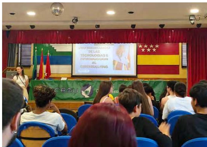
Los adolescentes reciben una formación sobre CODI

La revista CiudadEscuela pertenece al proyecto Participación Infantil y Juego Ciudadano de la CEMU