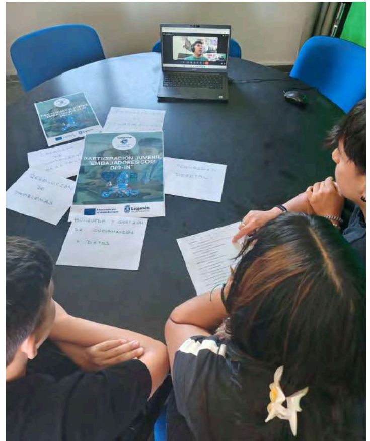
Los Embajadores CODI se reúnen con los grupos participantes

“Embajadores CODI DIG-IN” refuerza el compromiso de la CiudadEscuela Muchachos con la participación y el empoderamiento juvenil, así como con la inclusión y el aprendizaje cooperativo.