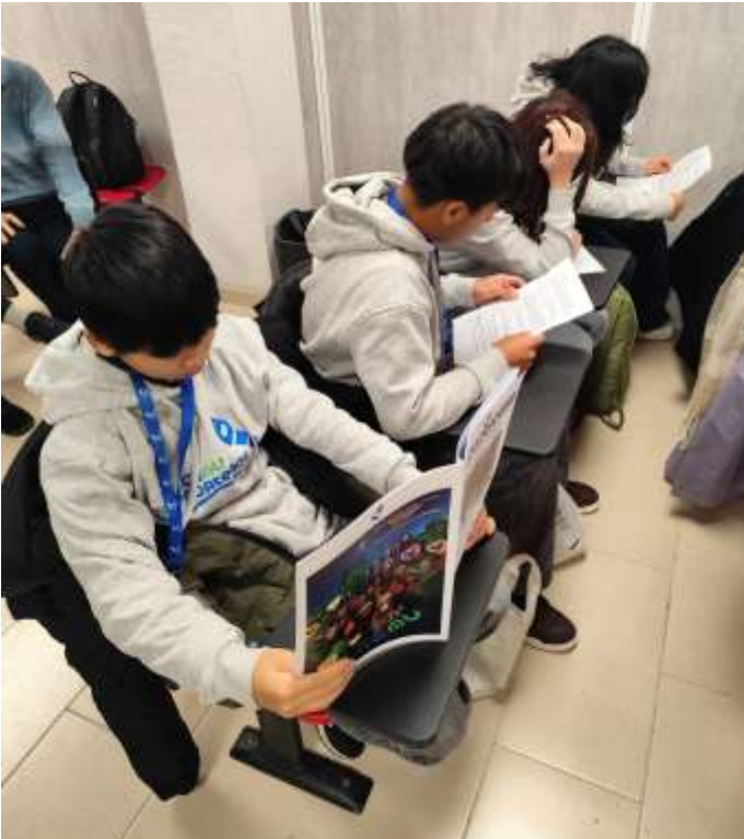
Los cemeneros preparan su exposición

Camino de 16 años. En Amnistía Internacional 11, me jubilé hace 11, y cuando me jubilé seguí participando en mi grupo aquí, pero me incorporé al equipo de educación de Amnistía Internacional Madrid, me hice activista de Amnistía Internacional.