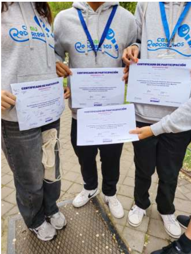
Los cemureporteros posan junto a sus diplomas de participación

No me esperaba así el Ciberencuentro. La verdad es que ha sido una gran experiencia. He podido conocer la actividad del grupo La Pinza y también, más a fondo, el proyecto de Ciberresponsales.