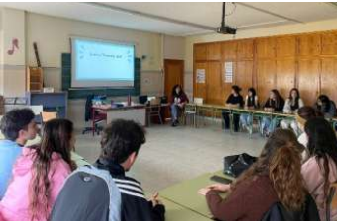
Los participantes del curso de Monitor de Ocio y Tiempo Libre

Además, este proyecto se configura como un motor de dinamización comunitaria, generando espacios de encuentro, aprendizaje y convivencia. A través de sus programas formativos y actividades, CEMU Escuela de Ocio y Tiempo Libre Comunitario contribuye a formar jóvenes comprometidos.