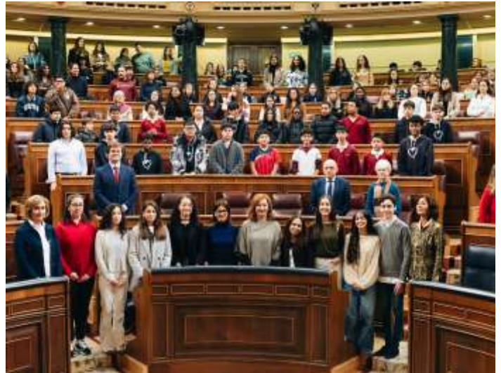
Asistentes al evento Infancia en el Congreso.

Los cemureporteros han tenido la oportunidad de entrevistar a Lola y a Leonor, dos de las representantes que hablaron en el Congreso de los Diputados y a representantes políticos asistentes al evento.