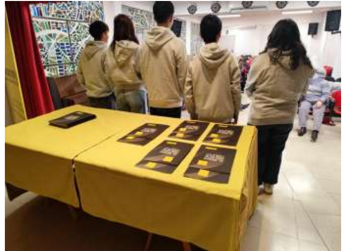
El grupo de adolescentes de la CEMU en el encuentro de escolares de Amnistía Internacional

Asimismo, se dieron a conocer el Taller de Comunicación y los proyectos Erasmus+ que desarrolla la entidad, poniendo en valor el compromiso de la CEMU con la educación y la participación.