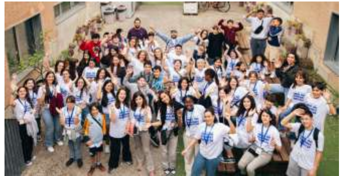
Ciberresponsales y Guías en el Ciberencuentro 2026.

A lo largo del fin de semana se han desarrollado talleres de periodismo y comunicación, espacios de