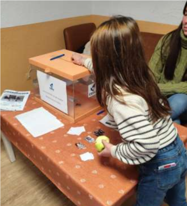
Los pequeños votan a su delegado de barrio

Desde 1970, la CiudadEscuela Muchachos (CEMU) impulsa un modelo educativo único en el que los niños, niñas y adolescentes ejercen su derecho al voto para elegir a sus representantes. Este sistema, inspirado en los principios de la Convención sobre los Derechos del Niño, promueve una participación infantil real y activa, convirtiendo a los más jóvenes en protagonistas de las decisiones que afectan a su vida cotidiana.