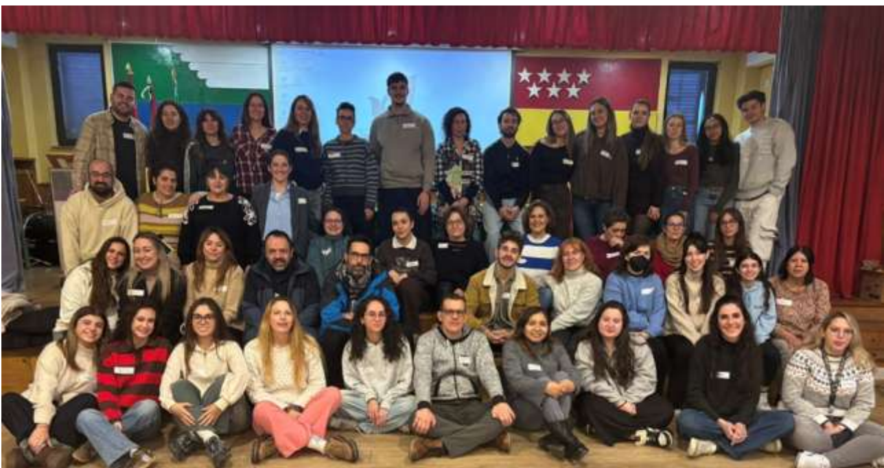
El equipo educativo de la CiudadEscuela

Además, la incorporación de este nuevo personal supone un paso clave para continuar avanzando en el proyecto educativo y social de la CiudadEscuela Muchachos, centrado en el bienestar, la inclusión y el futuro de la infancia y la adolescencia. Por otra parte, todos los profesionales de la ciudad de tejados verdes han tenido una sesión formativa sobre la Ley Orgánica de Protección integral a la Infancia y la adolescencia frente a la Violencia reforzando el Compromiso con la Protección y el Buen Trato hacia los niños, niñas y adolescentes que viven en los hogares de la CEMU. Esta sesión ha sido impartida para los nuevos profesionales recién llegados y ha servido de reciclaje para los trabajadores que ya la recibieron anteriormente.