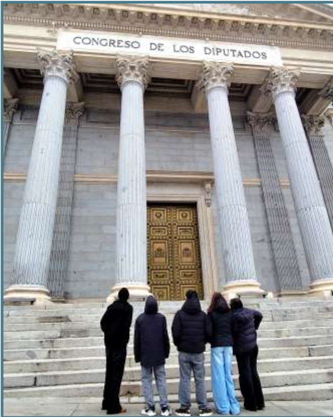
Cemureporteros en "Infancia en el Congreso"