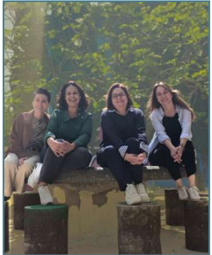
La CEMU renueva sus órganos de gobierno